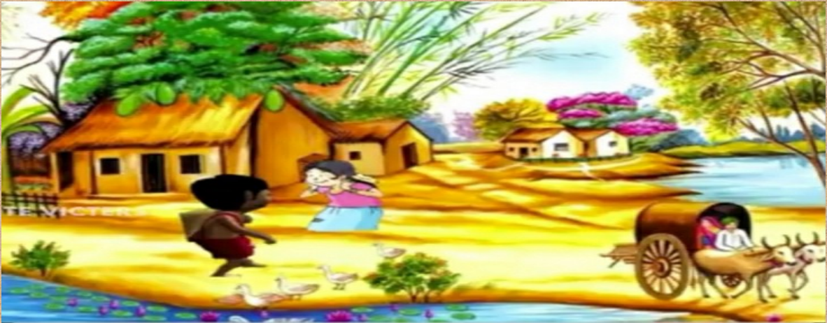
( പേജ് : 36 )

കുട്ടിപ്പുര കാണാൻ കൂട്ടുകാരനായ ഗോകുലിനെ ക്ഷണിച്ചു . ഗോകുൽ സാവിത്രിക്കുട്ടിയോട് കുട്ടിപ്പുരയെക്കുറിച്ച് പലതും ചോദിച്ചു . എന്തൊക്കെയായിരിക്കും അവർ തമ്മിൽ പറഞ്ഞിരിക്കുക ?