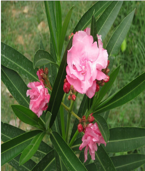
അരളി (നിരിയം ഇൻഡിക്കം) വ്രണങ്ങൾക്കും, കുഷുരോഗത്തി നെതിരേയും