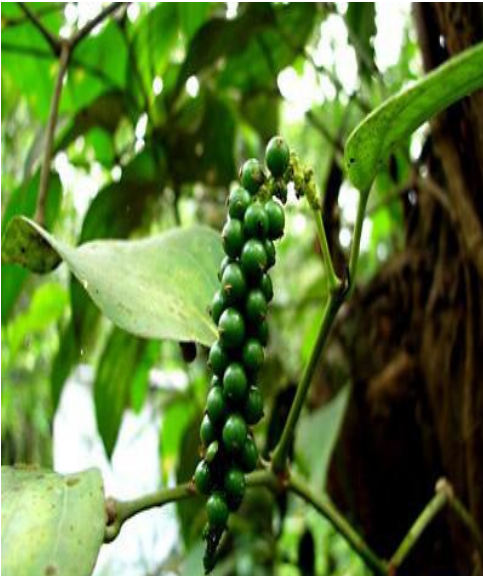
കുരുമുളക് (പെപ്പർ നെത്രം) ദഹനം പനി നീർക്കെട്ട് ചുമ തലവേദന