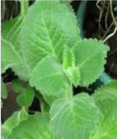
പനിക്കൂർക്ക പനി ചുമ ജലദോഷം