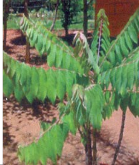
കീഴാർനെല്ലി (ഫില്ലാന്തസ് ഹ്രാറ്റേണസ്) മഞ്ഞപ്പിത്തം മൂത്രതടസ്സം താരൻ