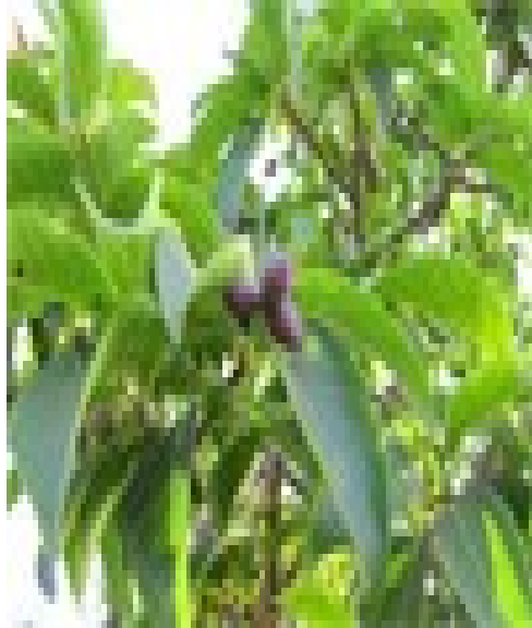
കടുക്ക (ടെർമിനേലിയ ചെമ്പുല) വാതം പൊള്ളൽ ദഹലക്കറവ് മുറിവ്