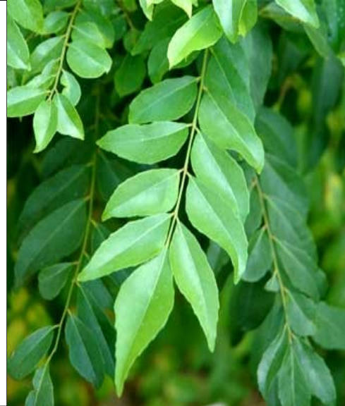
കറിവേപ്പ് (മുറയ കൊയ്യിജി) കണ്ണിന്റെ ആരോഗ്യം ദഹനത്തിന് തലമുടി കൊഴിയാതിരിക്കാൻ