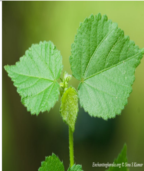
കുറുന്തോട്ടി (സൈഡ റൊറ്റൂസ്) വാതം രക്തസമ്മർദ്ദം ശ്വാസതടസ്സം