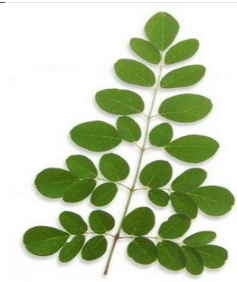
മുരിങ്ങ നെഞ്ചുവേദന വയറുവേദന കഫം വിറ്റാമിൻ എ കിട്ടുന്നു