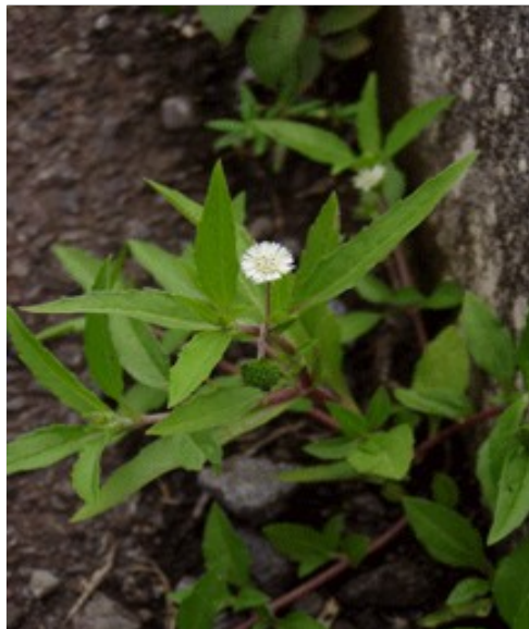
കയ്യൂണി വ്രണങ്ങൾ കൃമിശല്യം കുളിർമ്മ മുടിയുടെ വളർച്ച