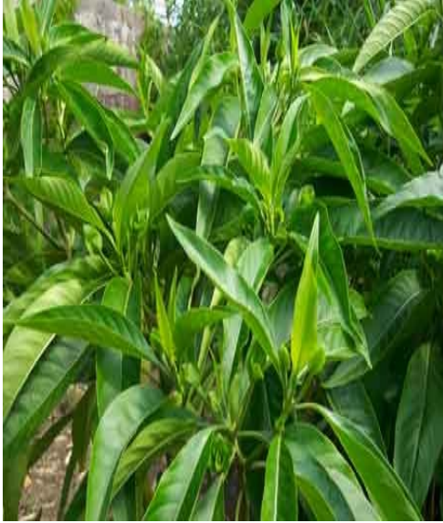
ആടലോടകം (ആടതോടവസിക) ആസ്തമ, ചുമ, ശ്വാസംമുട്ടൽ