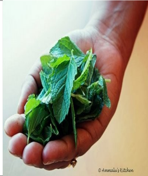
പുതിന ഉദരരോഗം വേദനസംഹാരി ഉൻമേഷം തരുന്ന