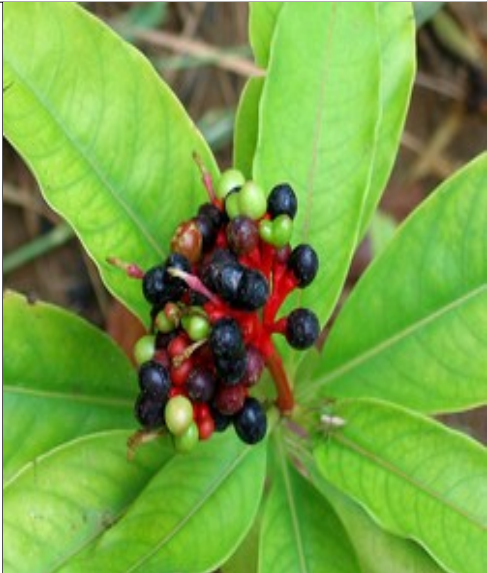
സർപ്പഗന്ധി (റാവോൾഫിയ) രക്തസമ്മർദ്ദ ത്തിനെതിരെ