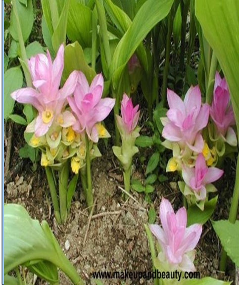
കസ്തുരി മഞ്ഞൾ (കർകമ അരോമാറ്റിക്) നിറം കിട്ടാൻ പ്രാണികളുടെ കടി ശ്വാസതടസ്സം വ്രണങ്ങൾ