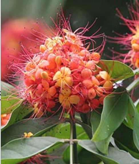
അശോകം (സരാക്ക ഇൻഡിക്ക) കരപ്പൻ, ചോറി, ചിരങ്ങ് രക്തശുദ്ധിക്ക്