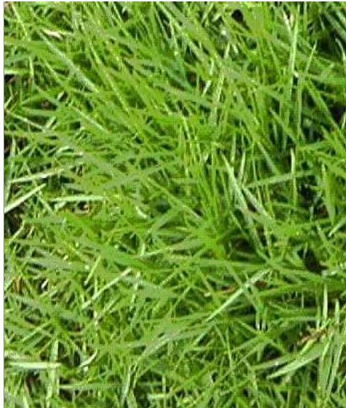
കറുക (സൈനോഡോൺ ഡാക്ടൈലോൺ) വയറുവേദന പ്രമേഹം പൊള്ളൽ ഓർമ്മശക്തിക്ക് അപസ്മാരം